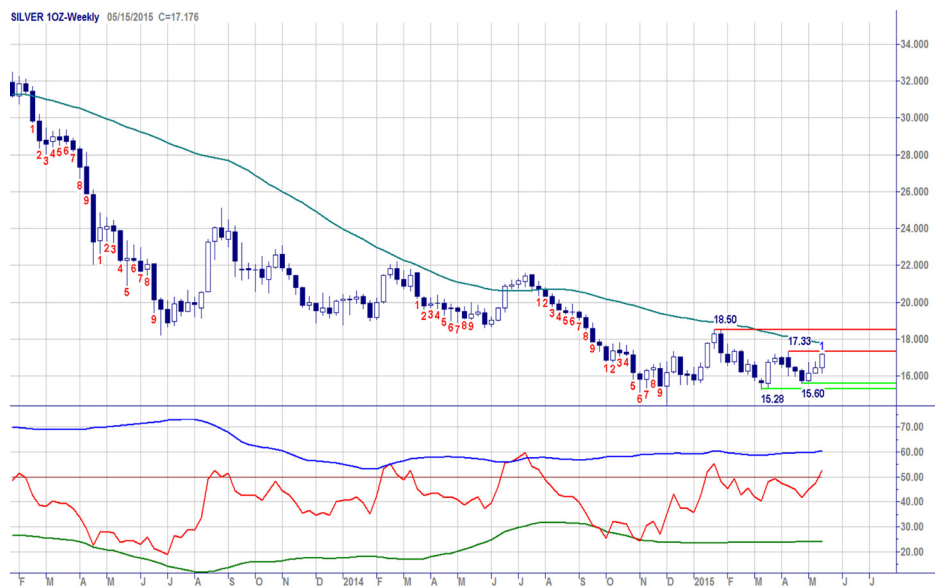
Weekgrafiek Silver

Offensieve spelers kunnen besluiten aan de koopkant in actie te komen, trendvolgers blijven aan de zijlijn.